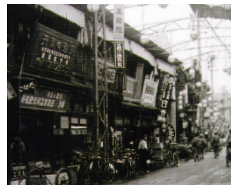
中央街の七夕1